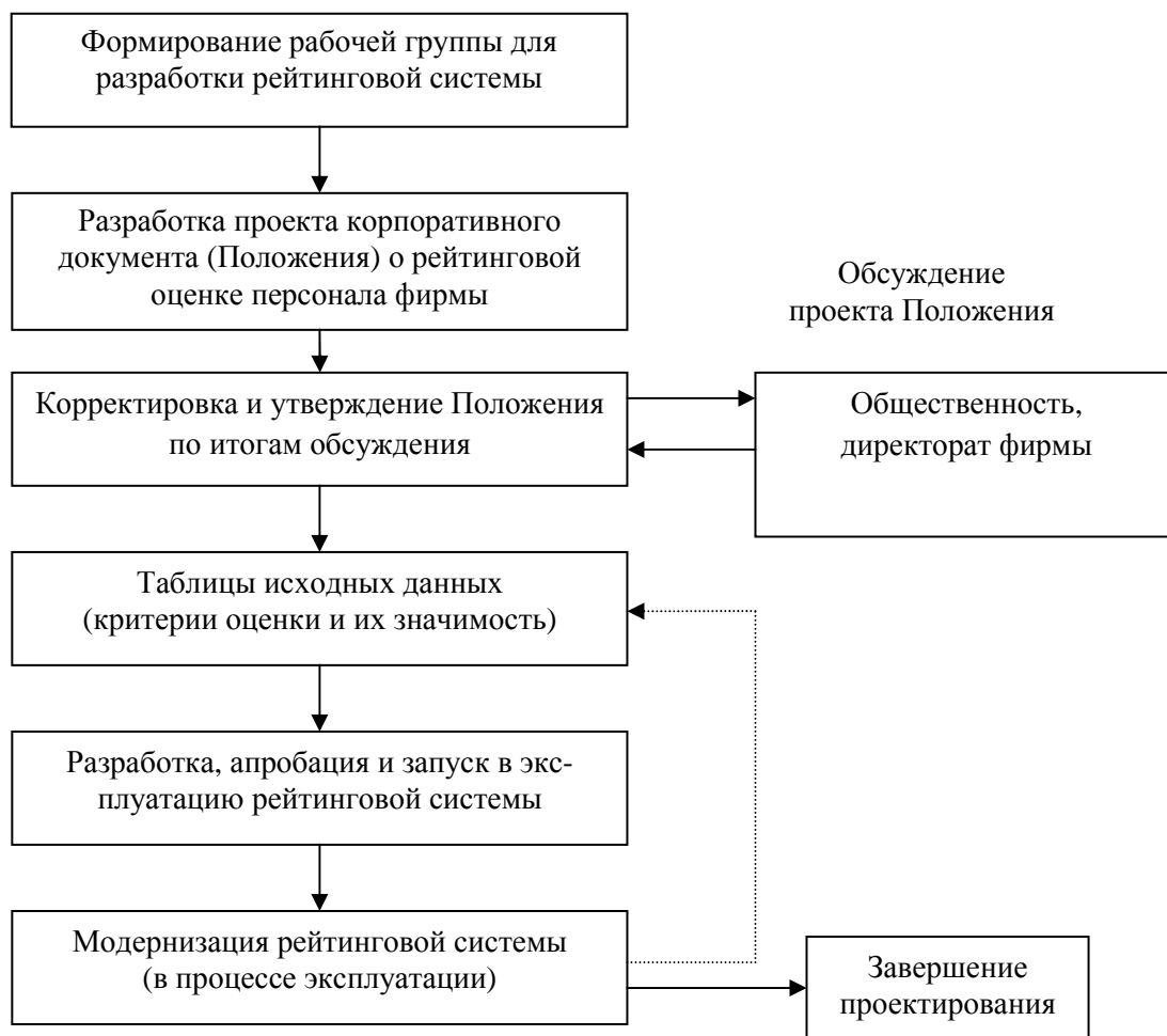
Рис. 1. Традиционная модель этапов проектирования рейтинговой системы оценки профессиональной деятельности персонала (научно-педагогических работников вуза)

очередь необходимо, чтобы все сотрудники вуза, чья оценка предусмотрена в рейтинговой системе, ввели все необходимые сведения о своей работе. Полученные после этого списки рейтинговых оценок должны быть проверены экспертами с целью выявления сотрудников, рейтинговые оценки которых, с их точки зрения, завышены или занижены.